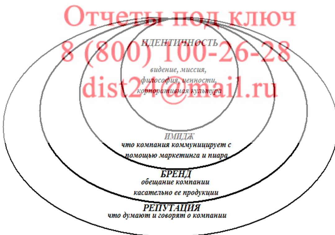
Рисунок 2. Структура процесса формирования репутации предприятия

Если говорить более доступно, то репутация формируется на базе имиджа, который в компании, как правило, создают специалисты бренд-менеджмента и имиджологии. Кроме того, следует определить и другие компоненты, которые являются неотъемлемыми в понятии «имидж компании» по мнению М. Стародубской (рис. 2).