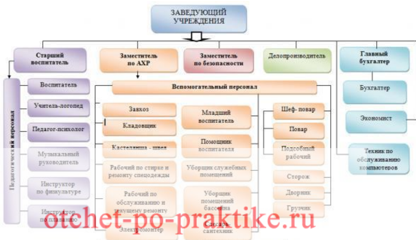
Рисунок 1 - Организационная структура ГБОУ Школа 2122 ДОУ Ручеек

Организационная структура представлена на рисунке 1.