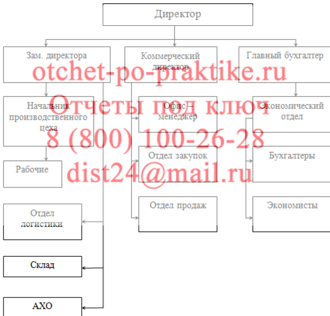
Рисунок 1 - Организационная структура ООО «Домашний интерьер»

Организационную структуру компании можно увидеть на рисунке 1.