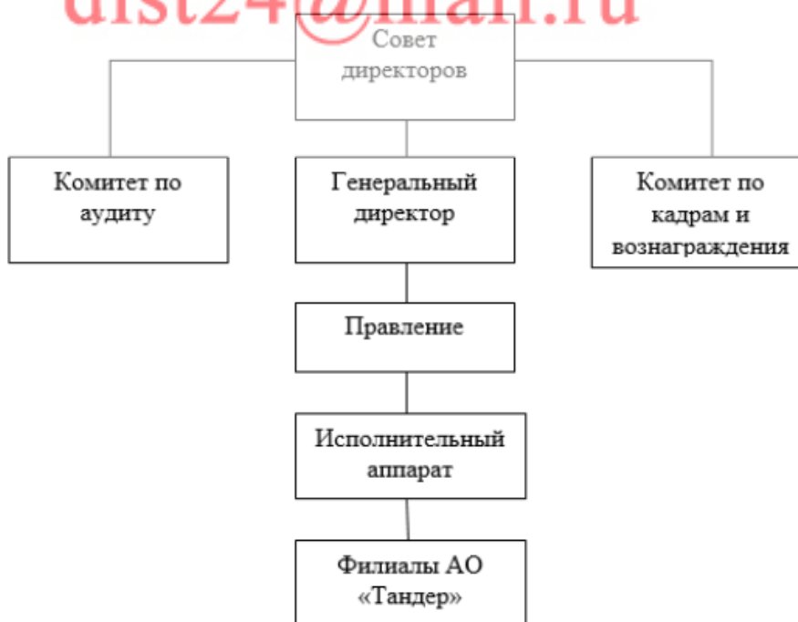
Рисунок 1 - Организационная структура управления

В процессе анализа организационной структуры управления приведем графическое изображение структуры АО «Тандер». Организационная структура управления представлена на рисунке 1.