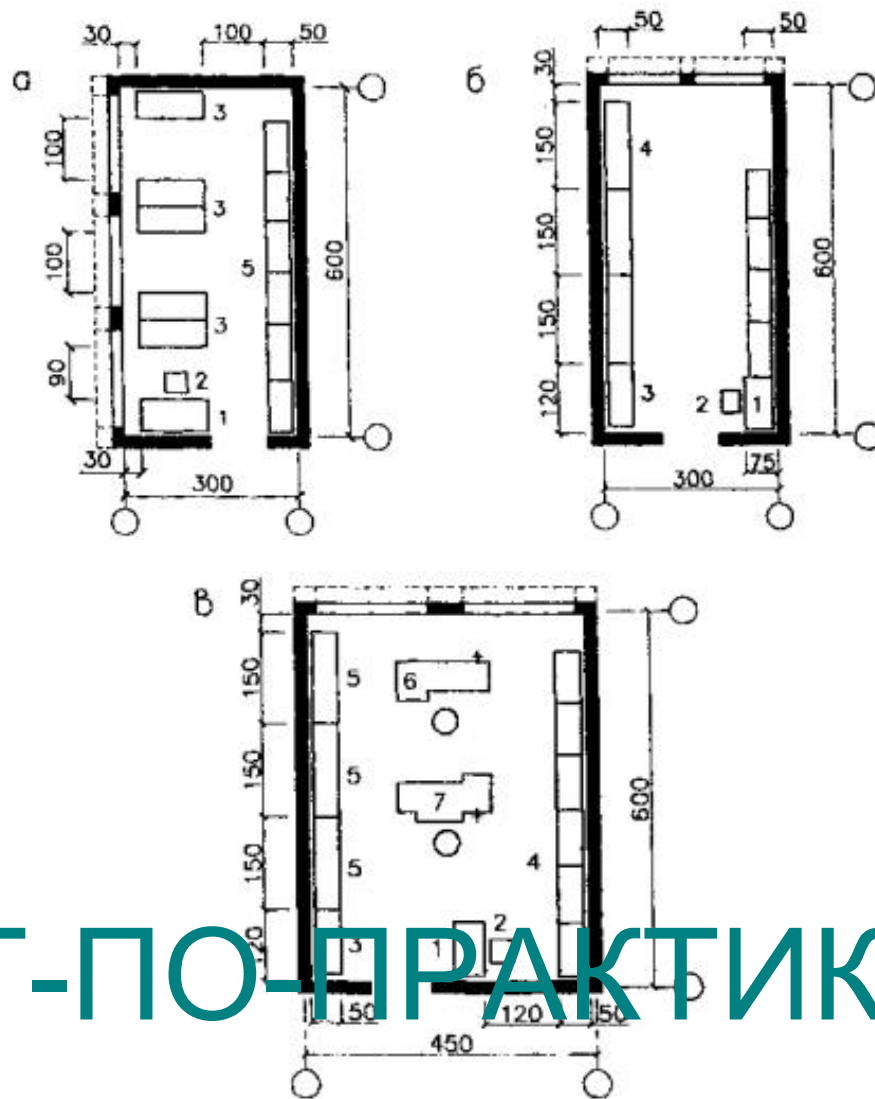
Рисунок 2 - Пример планировки складских помещений

а - инструментальная кладовая; б - склад готовой продукции; в - склад заготовок и материалов. 1 - стол рабочий; 2 - стул; 3 - стеллаж ячеечный; 4 - стеллаж универсальный; 5 - шкаф инструментальный; 6 - станок токарно-винторезный; 7 - станок отрезной; 8 - станок фрезерный универсальный; 9 - стенд сборочный; 10 - тумба для инструментов; 11 - верстак слесарный; 12 - станок вертикально-сверлильный; 13 - станок токарно-винторезный; 14 - станок плоско-шлифовальный; 15 - станок кругло-шлифовальный; 16 - станок точильный; 17 - подставка для настольного оборудования; 18 - подставка для разметочной плиты; 19 - электроталь.