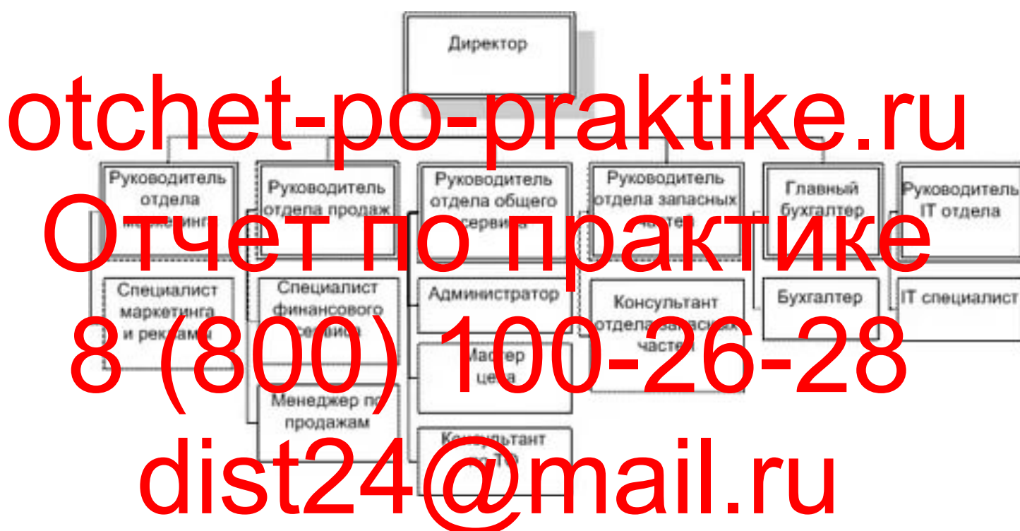
Рисунок 1 - Организационная структура ООО «Национальная медслужба»

ООО «Национальная медслужба» имеет генерального директора. В его подчинении находятся все линейные и функциональные руководители. Структура компании включает в себя несколько отделов и подразделений, основные элементы представлены в виде схемы ниже.