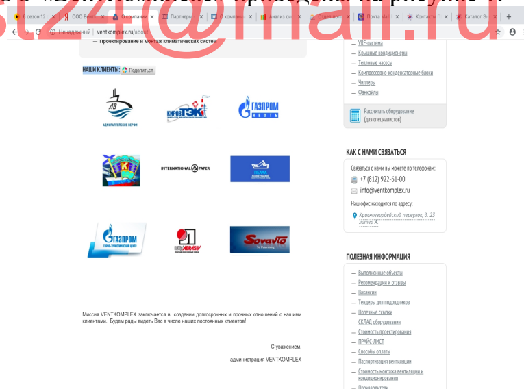
Рисунок 1 - Клиенты ООО «ВентКомплекс»

Клиенты ООО «ВентКомплекс» приведены на рисунке 1.