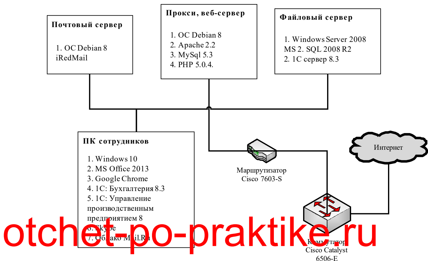
Рисунок 1 - Программная архитектура предприятия ООО «ВедьмаКомплекс»

В компании установлены три физических сервера, на которых, соответственно, работают три программных сервера.